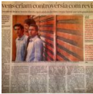
Folha de S. Paulo - 16/07/2009 - Ilustrada E3